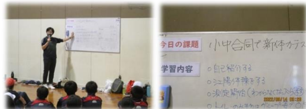
子どもたちの課題意識や意欲を高める

江別太小学校と同じように、互いに挨拶と自己紹介、準備体操の「江陽体操」を行ってから各種目に取り組みました。豊幌小学校の5年生が全部で16名のため、小学生1人に中学生2～3人がつく形でグループをつくりました。そのため、中学生が「次は立ち幅跳びをするよ！」「水を飲んでいいよ！」等と小学生に声をかけ、気遣う場面がたくさん見られました。また、今回は時間的に少し余裕があったので、最後に持久力を測定する「シャトルラン」に挑戦しました。その際も、見守る小学生や中学生から自然と「がんばれ！」と応援する声がかかり、拍手の音が体育館に響きました。