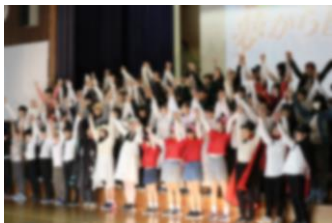
6年生 夢から醒めた夢