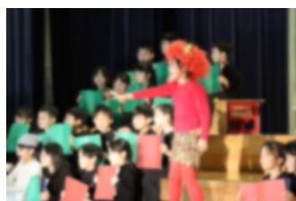
2年生 ないた赤おに