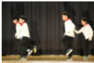
わかば 歌って踊ってケセラセラ