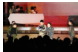
4年生 本当のたから物は