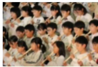
3年生 スウィング♪3年生月