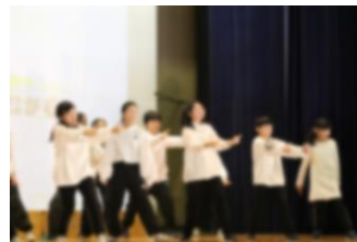
5年生 輪~みんなの心を一つに奏でよう!~