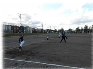
野球部の体験の様子と小学校でのバスケットボール部体験の様子（中央中学校区）