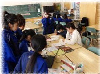
美術の体験の様子と第一中・江陽中合同のサッカー部の練習（第一中学校区）