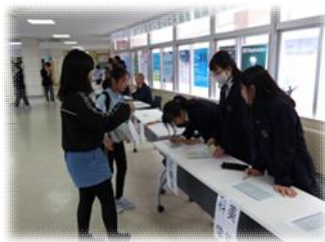
受付を担当する生徒会役員と部活動を紹介するポスターの展示（中央中学校区）

部活動は、異学年の生徒が集い一緒に活動する中で、自主性や協力性、思いやりの心等を育てていく場となります。また、目標に向かって努力することの大切さや達成の喜びを実感することができ、自己肯定感や責任感、連帯感等を涵養するものです。今回の部活動体験は、先輩の姿を通してこれらの効果を感じることできる機会でした。