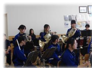
楽器の紹介をする中学生と吹奏楽部のパンフレットの一部分（第一中学校区）