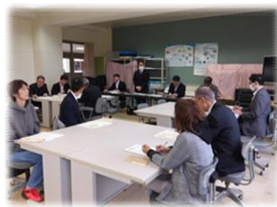
4校合同の学校運営委員会の様子

10月16日（木）の市内一斉公開に合わせて野幌中学校区のコミュニティ・スクールの学校運営委員会が、野幌中を会場にして合同で開催されました。小中一貫教育の本格導入に合わせて行われてきた取組で、今年度も野幌小、東野幌小、野幌若葉小、野幌中の4校の学校運営委員の方々が顔を合わせ、各校の学校経営や特色ある教育活動、小中一貫教育の実践等について、共通理解を図りました。野幌中学校区は3小1中と学校数が多く、市内全域から児童が通学する特認校である野幌小が所属する中学校区ですが、同じ野幌地区の学校として、4校が連携・協働しながら「地域とともにある学校づくり」を進めています。