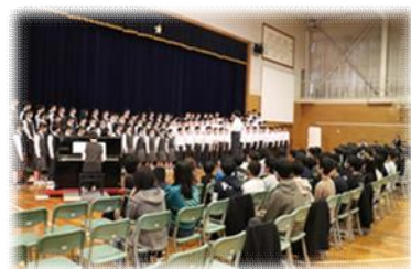
二中祭への参加 中3の合唱を鑑賞

さらに、10月23日（木）に、第二中学校区の総合的な学習の時間の共通探究テーマ「SDGs」の中の「4番 質の高い教育をみんなに」に関連した学習として、第二中の生徒が小学校を午前中に訪問し、授業を参観したり、小学校の先生方にインタビューをしたりしました。インタビューでは、校長先生に「よりよい学校づくりのために大切にしていること」、担任の先生には「子どもたちがわかるまでいねいに教える工夫や学ぶ楽しさを伝えるためのしかけ」について質問する等、生徒たちは熱心に活動していました。