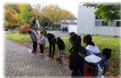
第4回挨拶運動の様子