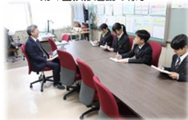
小学校でSDGsについて調べる