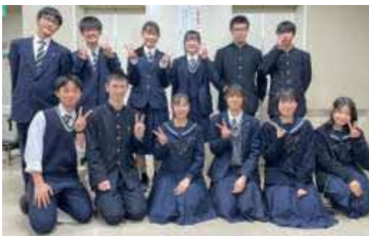
参加者が自分の意見を話しやすい雰囲気をつくって会議を進めてくれた千歳高校、北広島高校の皆さん

子ども未来会議（どさんこ☆子ども地区会議）では、石狩管内の小学生、中学生、高校生が「いじめのない学校にするために、自分たちが取り組めることは何か」をグループに分かれて話し合いました。会議を参観した学校、企業、教育委員会の方から感想や応援メッセージをいただきました。大人のみなさんは、会議の様子を見て、とても感心していました。