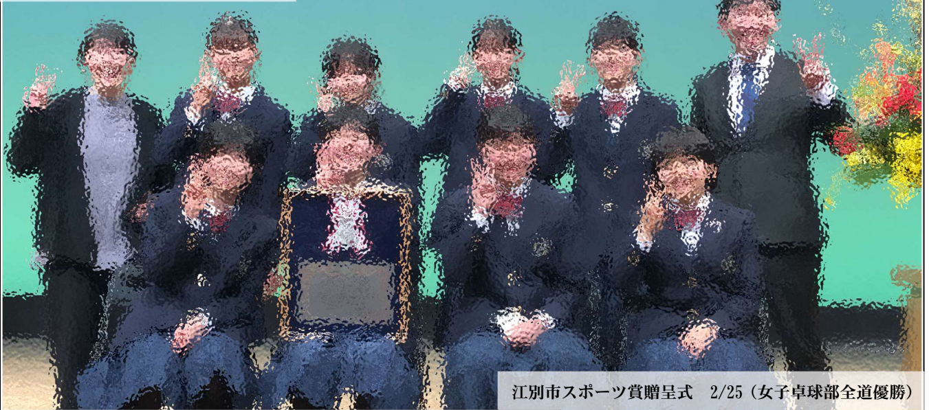
江別市スポーツ賞贈呈式 2/25 (女子卓球部全道優勝)