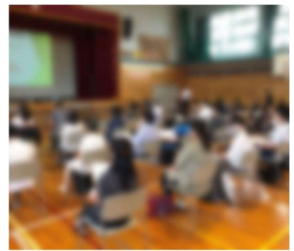
中央中校区小中一貫教育拡大推進会議

教育目標(私たちの目標) 「ふるさとので大地で 知性を磨き 心を耕し 体を鍛えよう」