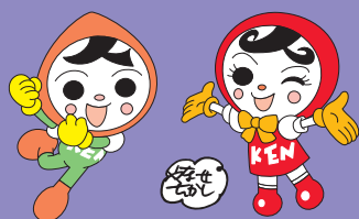
人権イメージキャラクター 人KENまもる君 人KENあゆみちゃん