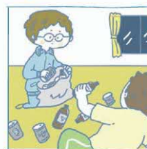
アルコール・薬物・ギャンブル問題を抱える家族の面倒を見ている