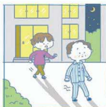
目が離せない家族の見守りや声かけなどの気づかいはしている

*北海道ヤングケアラー実態調査(札幌市立を除く道内の公立中学校2年生および公立中学校2年生および公立高校2年生(全日制・定時制)を対象に2021年に実施)より