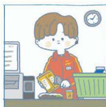
家計を支えるために仕事をしている