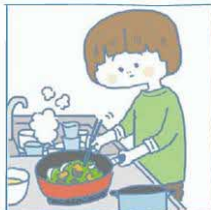
病気や障がいのある家族のために、家事をしている