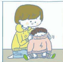
家族に代わって、幼いきょうだいの世話をしている