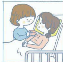
病気や障がいのあるきょうだいの世話や見守りをしている

30人のクラスなら 1人か2人いる計算になるね 道内中高生の約 25人 に 1人