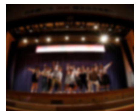
生徒会役員の発表