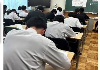
3年生が学校で行う最後のテスト「学年末テスト」

生徒たちが作品として自己表現することで、自分の可能性を広げるとともに、校内全体が明るく生き生きとした雰囲気になっています。