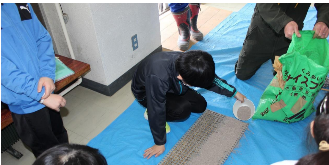
③全部のあなに糺を入れたら、上から土をかけま