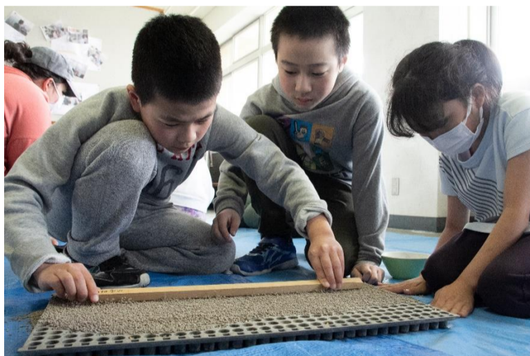
④全部のあなに土がしっかりと入るように、ていねいに板でならし