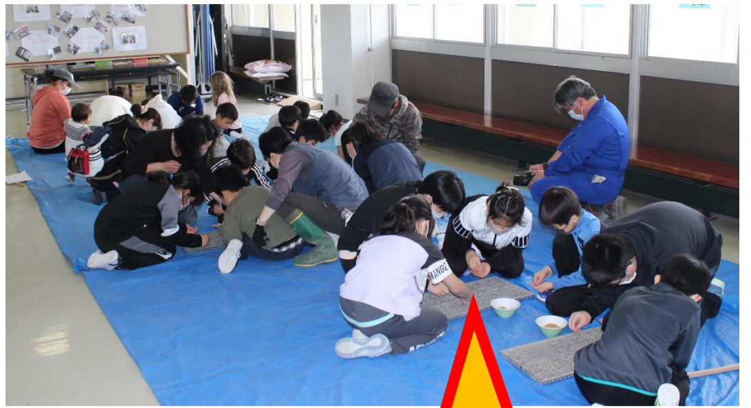
②ひとつのあなに、4~5つづの