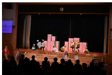
1.2年音楽・劇 「ようこそ、 いきものげんしりんスクールへ」