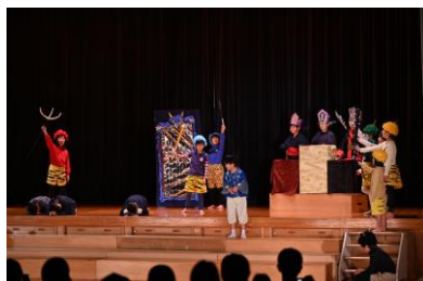
3.4年劇 「じごくのそうべえ」