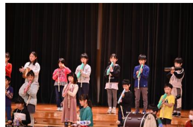
3.4年音楽 「Would tour」