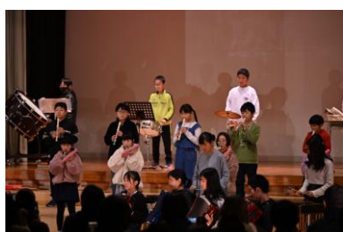
5.6年音楽 「全力少年 フット・オン・クラシックス」