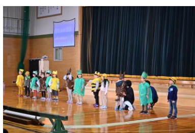
1年 「はじめのことば」

11月18日(土)に「学芸会」が行われました。1. 2年生は「ようこそ いきものげんしりんスクールへ」という劇を行い、その中で鍵盤ハーモニカの演奏も発表しました。3. 4年生と5. 6年生は、それぞれ音楽の発表と劇を行いました。どの学年も「感動をみんなに～笑顔を広げる学芸会～」のテーマのとおり、素晴らしい発表を見せてくれました。