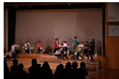
5.6年劇 「ぼくらマスクの夏」