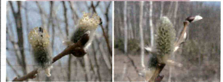
雌雄異株(左:雄花、右:雌花)