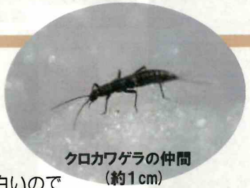
クロカワゲラの仲間 (約1cm)