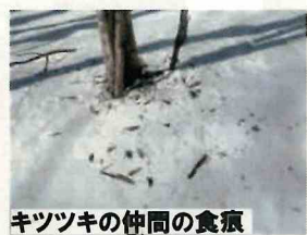
キツネの仲間の食痕