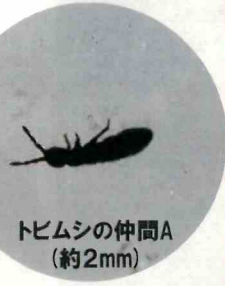
トビムシの仲間A (約2mm)