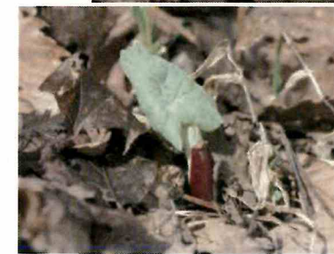
地下茎で花と葉が繋がっています。花が咲いた後に葉が出てきます。