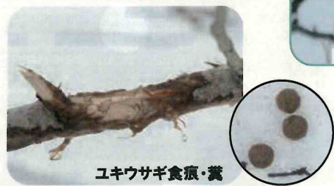
ユキウサギ食痕・糞