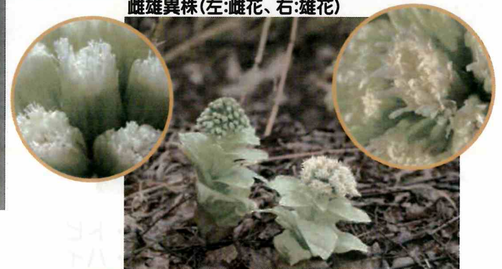
②アキタブキ花 3月下旬～4月下旬 雌雄異株(左:雌花、右:雄花)