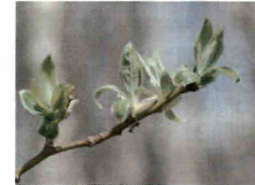
花が終わった後に葉が芽吹く