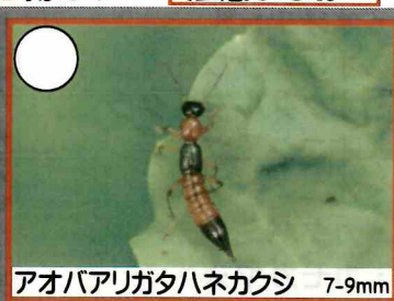
アオバアリガタハネカクシ 7-9mm