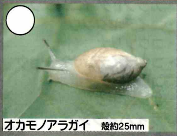
オカモノアラガイ 殻約25mm