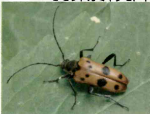
モモトカミキリモドキ

コウチュウ目(鞘翅目) アオウスチャコガネ アオジョウカイ アオバアリガタハネカクシ アオハナムグリ アカハネムシの仲間 オオアカコメツキの仲間 オオクチカクシゾウムシの仲間 オトシブミ揺籃 カタクリハムシ クロマルエンマコガネ サビキコリ ジョウカイボン ハナウドゾウムシ ヒラタシテムシ ミヤマクワガタ モモトカミキリモドキ ヨツボシヒラタシテムシ