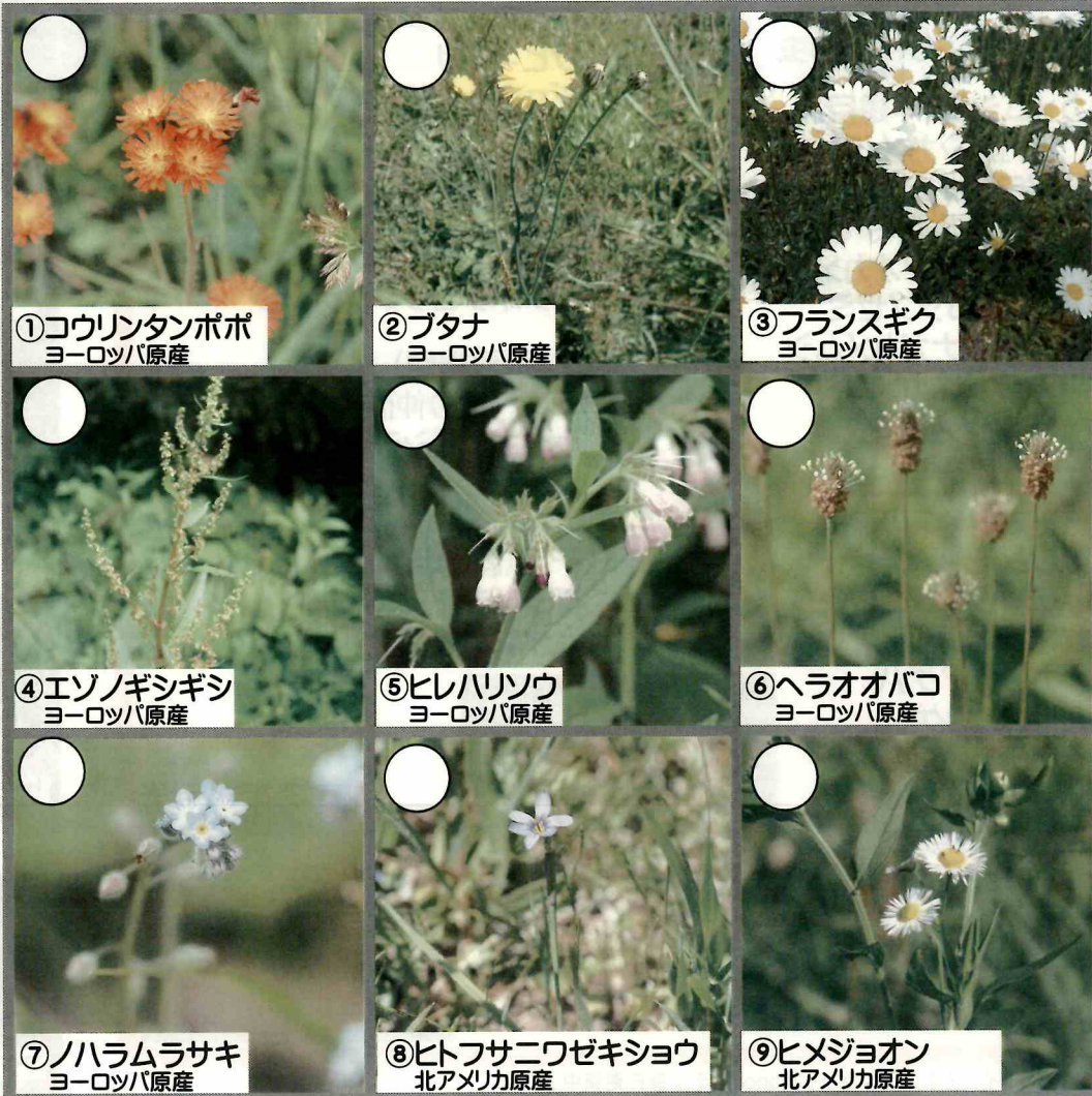
①コウリントンポポ ヨーロッパ原産