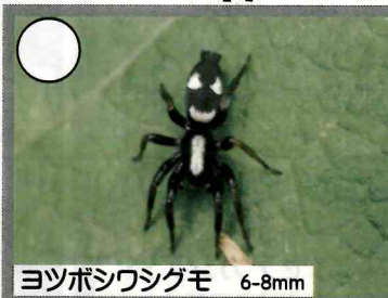
ヨツボシワシグモ 6-8mm