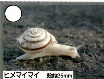
ヒメマイマイ 殻約25mm