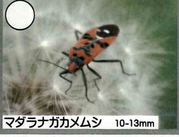
マダラナガカメムシ 10-13mm