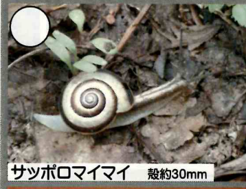
サツポロマイマイ 殻約30mm