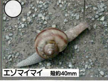
エゾマイマイ 殻約40mm