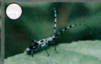
ルリボシカミキリ 18-29mm