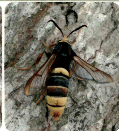
キタスカシバ(ガの仲間)