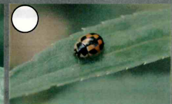
コカメノコテントウ 3.5mm