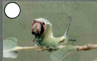
モクメシャチホコ幼虫 55mm