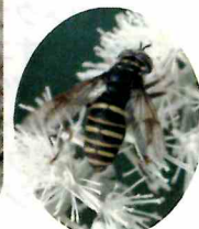
マツムラナガハナアブ (ハナアブの仲間)