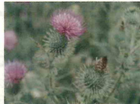
セイヨウオニアザミ※