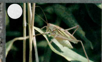
ハネナガキリギリス 38-50mm