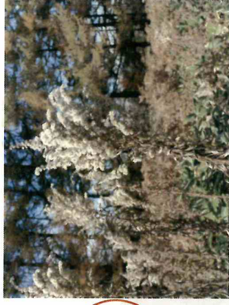
ケカナダアキノキリンソウ

全体的に果実のなりが良い年でした。 まだ枝についている果実もあるので 頭上や足元に注目すると面白い発見が ありますよ♪