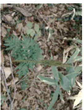
エノユハナツラビ(シダ) 秋に葉を出し、冬でも緑色