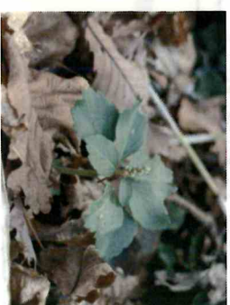
フツキソウ 常緑の小低木