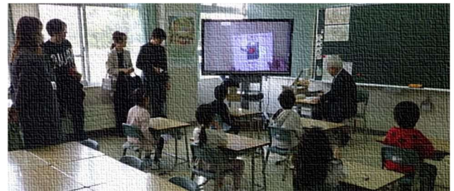
はじめての参観日（1年生）まっすぐ座っています！

ため、中に詰めていただくようお声がけした学級もあるほどの盛況ぶりでした。その後の学級懇談会でも、談笑や和気あいあいとした雰囲気が廊下にまで伝わってきました。進級後のお子さんの様子や今後1年間の学習、行事、PTA活動などについて各担任からお話させていただきました。