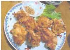
▲衣はカリカリ、肉汁たっぷり