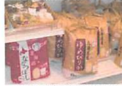
▲9月の中旬からゆめびりかやなつぼしの新米が販売中！

入荷時間： 午前6時30分~午前9時 新鮮な野菜を購入したい方は、早めの来店をおすすめします。午後には人気野菜やフルーツは完売する可能性があります。