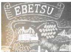
▲江別の姉妹都市と友好都市の繋がりがわかるチョコレートアート。