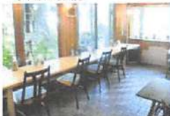
▲木の温もり溢れる店内では、自然を楽しむながら食事ができる