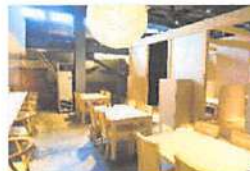
▲開放感あふれる店内。木がメインで落ち着く雰囲気。