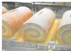
▲おすすめは生ロールケーキ。ハーフサイズもある。