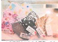
▲自家製のマスクも販売。これでコロナ対策もバッチリ！

デリバリーもオススメ！ 2000 円以上お買い上げの場合配達料が無料！ コロナ禍でお店に足を運ぶにくい方オススメ。※お弁当のご予約は前日の 15 時まで