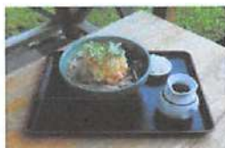
▲テラス席あり、自然を味わいながら蕎麦を堪能出来る。