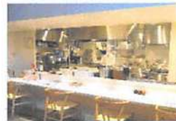
▲カウンター席もあり、お一人様でも気軽に来店できる。