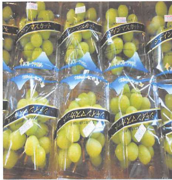
▲これからの時期とてもおいしいマスカット。子供も食べやすく大人気。ケーキの材料としても使われています！