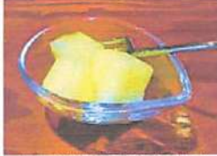
▲とても粘度の高い黄色いスイカのデザート。