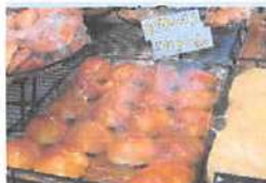
▲菓子パンも充実。中でも野幌クリームパンは大人気！