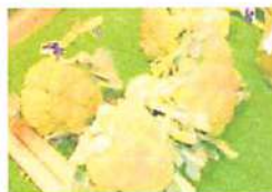
▲目玉商品の一つ江別の特産のブロッコリーも数多く並ぶ。

URL https://www.yumechikara-terrace.jp/store/nopporo/