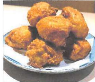
▲手のひらがうまるほどの特大ボリューム。お手頃価格でコスバの唐揚げ。

野幌駅の近くにある「EBRI」の中のオシャレな日本料理のお店。和をイメージした客席と、調理の様子が見られるオープンキッチン。食材にもこだわっており、北海道産のものを使用したメニューも多数。テイクアウト商品も充実しており、今の状況でも安心してお家で料理が楽しめます。