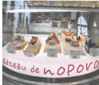
▲人気商品のデコレーションケーキは種類が豊富で誕生日がもっと楽しくなるはず。

お店の商品は生クリーム・牛乳・卵・小麦粉に北海道や地元の材料を使っています。一つ一つ丁寧に作りあげていて、ケーキは材料を仕込み、いくつもの工程を経て出来上がります。ムース等、一度固めて仕上げるケーキは丸二日かかります。ガトー・ド・ノポロは、一つ一つのスイーツに気持ちを込めて提供しています。