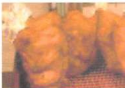
▲半身あげは常にランキング上位の大人気メニュー。