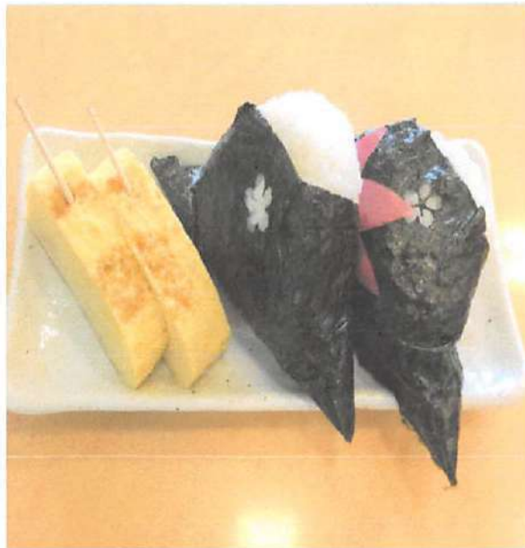
▲魚沼産コシヒカリを使用して作られた美味しいおむすび。具の種類もいろいろあって楽しめる。たまご焼きやお肉など、お米に合いそうなおかずがいっぱい！