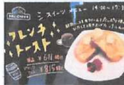
▲イートインも有。フレンチトーストなどのメニューも充実。