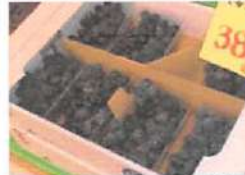
▲果実では、取り立てのブドウやメロンなども販売！！