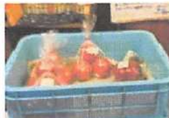
▲採れたて新鮮な自家製野菜を販売。

心を込めて蕎麦を打ち続ける本格手打ち蕎麦のまめひな。時間をかけて作っている蕎麦は、切りにもこだわり、細めてつるつとした食感の麺。至極の逸品に仕上がっている。蕎麦だけでなく野菜も自家栽培のものをできるだけ限り使用するなど、様々なこだわりが！