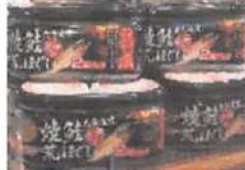
▲鮭の荒ほぐしはご飯がすすみ時間の無い朝にもオススメ！