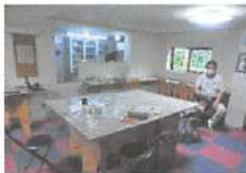
▲店内は広々としたスペースでゆったりとした空間です。