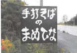
▲道道江別恵麻線沿いにあるこの看板が目印。

テイクアウトもOK! 蕎麦がなくなる場合がありますので予約をおすすめします。 ※ただし気温や湿度の高い日は食中毒の問題からお断りさせていただきます。