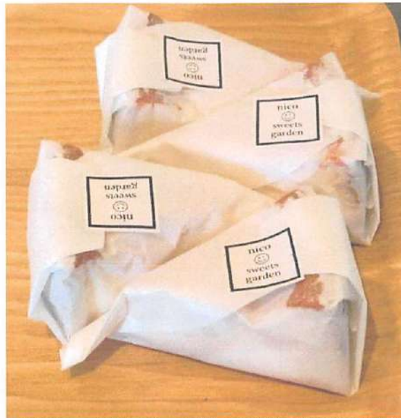
▲看板メニューの「NY チーズケーキ」はオープン当時から的人气商品。値段もお手頃!!