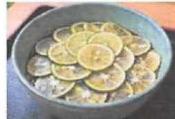
▲期間限定メニューすだちそば。