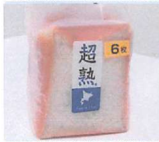
▲一番人気の食パンには19時間以上の時間をかけてこだわって作られている

野幌原始林にある「ゆめちからテラス」の中にある夢パン工房。明るく開放感のある店内には、おいしいパンが並んでいる。パン生地は100%北海道産の「ゆめちから」春よ恋「きたほなみ」をブレンドして使用し、地元だけでなく、江別市民にも愛される人気のお店。