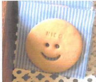
▲niconico クッキーは、開店半年記念の限定商品から定番商品になった。

ニコ・スイーツ・ガーデンでは、スイーツが20〜30種類、そして限定商品やきまぐれ商品などを含め、メニューは100種類程度ある。また、パレンタイオンやホワイデーのようなイベント時には、期間限定でネット販売することも。詳しくはホームページをチェック。