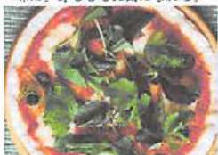
▲真っ赤なトマトソースをたっぷり使用したピッツァ。