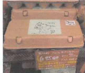
▲ヒナから大切に育てられていて、抗生剤などの薬剤は不使用。新鮮で体に良い卵。

野幌駅近くのEBRI内にある「おいで屋」。体に良くない添加物や農薬、化学的な肥料を使わないおいしい食べ物を食べて、心も元気な人が増えてほしいという願いからこのお店が生まれた。「食べた物で体が作られる」をモットーに体に良い様々な商品を取り扱っている。詳細はHPをチェック。