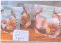
▲プレゼントにもピッタリなギフトセット。