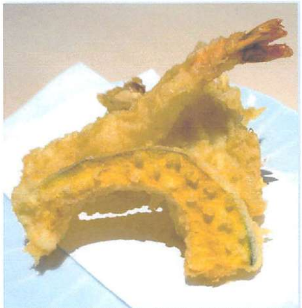
▲カリッと香ばしい天婦羅に、4種の自家製塩をかけてさまざまな味を楽しめる。このお店一番の人気メニュー。