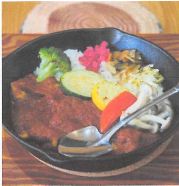
▲ほとんどが江別産の野菜で作られているカレー。子供でも食べられる人気のメニューです。