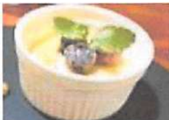
▲カタラーナにフルーツも乗っけて子供にもおすすめ。