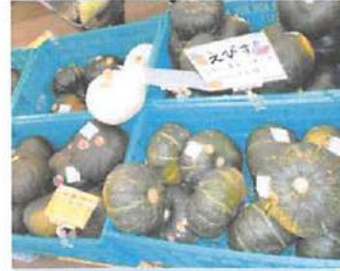
▲9月、10月頃には、かぼちゃ、いも、ばれいしよなどが旬の野菜

江別市内の野菜とその鮮度にこだわった「のっぽろ野菜直売所」。野菜はもちろんです。春には野菜の苗、秋や冬には生花も販売している。9月に販売される「ななつぼし」や「ゆめびりか」の新米は特におすすめ。11月から11月にかけて販売される大根、白菜、キャベツなどは、これからの時期つけもの材料としても最高。