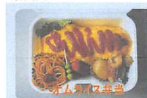
女性にもちょうどよいサイズで300円

▲一番人気の日替わり弁当はザンタレ弁当(月曜日)。1つ500円のワンコインがうれしい。