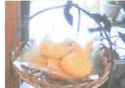
▲ケーキの他にクッキーやカフェラテなども販売