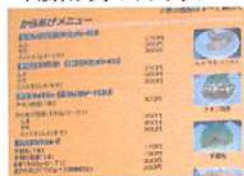
▲豊富なメニューからお気に入りを見つけてみよう!