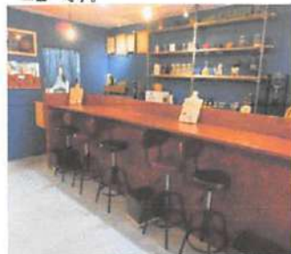
▲店主こだわりの内装、年齢関係なく楽しめる店内。

店主が食生活に気を配っていることや、元々キャンプやアウトドアが好きなことから、無添加の野菜料理をメインとして作り始めました。料理だけでなく内装にもこだわっていて温かい雰囲気を楽しめます。料理はとっても美味しく、内装もおしゃれなのでぜひ行って食べてみてください。詳細はHPをチェック。