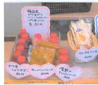
▲選べるタレで自分好みの味を楽しむことができる!

他の唐揚げ店ではもも肉を使うことが多い中、鶏笑では北海道産むね生肉を使用。さらにタレは大分県中津市の中津醤油、生姜にんにく、数種類のハーブをブレンド。他店には出さないのできかない美味しさをぜひ体験してみてください!