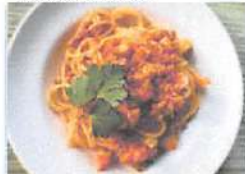
▲まごころスパイスで優しいお味に。身も心も元気になれる。