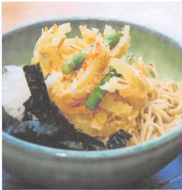
▲冷やしかき揚げそばには辛味大根がついています。揚げ物でも辛味大根のおろしで後味がさっぱりとした味が一番人気の秘けつ。