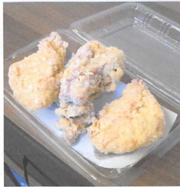
▲注文を受けてから揚げのこだわりのからあげはいつでもカラッとサクサク!冷めてからでも美味しいのでいつ買っても大丈夫!