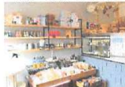
▲内装は海外のお菓子屋さんのようなワクワクする空間。