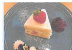
▲江別産小麦と北海道生クリーム、花屋で採れたハーブを使用

豊かな自然に囲まれ、まるで物語の中にいるような雰囲気!「庭の花」という店名には、庭に植えたり家の玄関先などを彩るためのお花がたくさんありますよ!という意味が込められているそう。きれいな花と手作りのおいしいケーキの両方を一度に楽しむことができ、心安らぐひとときを過ごすことができます。