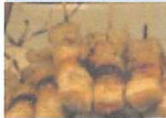
▲プライベートブランドのつやがきれいに出来るたれを使用。