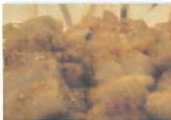
▲焼鳥を焼くときは真心こめて。その場で店員が焼いている