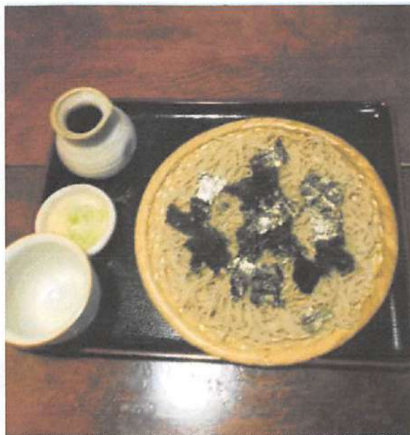
▲蕎麦は北海道産の蕎麦粉と、水、小麦粉を使用しており、つゆ作りや長ネギの切り、米とぎや大根をおろすのを含め4~5時間かけて作られる。