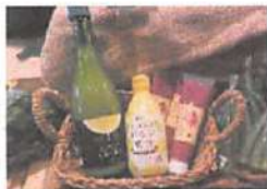
▲調味料の売れすじ商品は1位レモン果汁。2位は梅びしお。