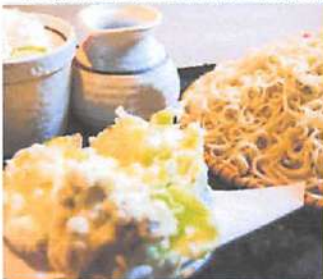
▲時期によって変わる色々な種類の天婦羅。春夏秋冬で変わるこの味は正に絶品。

創業十六年の蕎麦屋。道内産の蕎麦粉を使用しており、独自にブレンドした蕎麦粉は蕎麦本来の風味、旨味が凝縮している。つゆは厳選した国内産のカツオをブレンドし、コクのある深みが口の中にふんわり広がります。秘伝の「かえし」も三ヶ月熟成させたコクのある深みでカツオの風味と至極のハーモニーを奏でる。