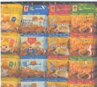
▲高知県民のソルフードともいえるミレービスケット。種類も豊富に揃っています。

エブリ内に店舗を構える江別のアンテナショップ「姉妹都市「グレンシャム市」・友好都市「土佐市」の特産物と江別の特産物を販売しています。江別と姉妹都市・友好都市との歴史は深く、その関係は40年以上も続いています。その2つの都市について多くの方に知ってもらうことをやりにこのアンテナショップを営業していきます。