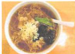
▲あっさりとした食べやすい味付けの正油ラーメン。