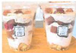
▲これからの季節にあった果を使った「ワンコインパフェ」

URL https://ja-jp.facebook.com/nicoosweetsgarden/