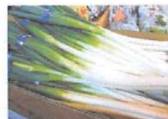
▲冬になると少なくなる北海道産の野菜が今おすすめ！