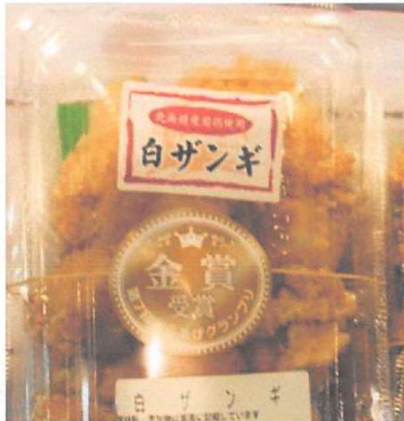
▲イチオシの白ザンギは 100 グラム 100 円という超激安価格でこの美味しさ！不動の人気 No.1！