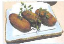
▲「札幌黄のとろとろフライ」入手しづらい幻の玉葱を使用。