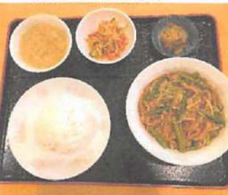
▲細切りの肉やたけのこの食感が楽しめるスタミナ定食。

昭和62年から営業しており、平成7年にあさひが丘に移店。昔ながらの雰囲気のある中華屋さん。あっさりとした食べやすい味付けで、食材は主に北海道産、江別産にこだわっている。お店は店主と奥さんの二人で営業している。定食などはボリュームもたせており、出前もできる。