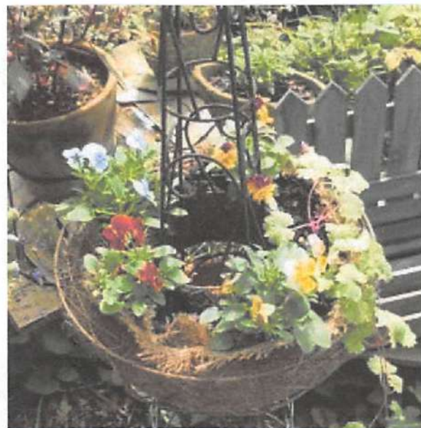
▲庭の花では、来年も楽しめる宿根草のプリムラ類や、パンジー、ビオラなどの一年草のほか、数多くの花や球根が売られている