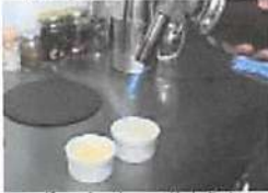
▲ガスバーナーで焼き色をつけて香ばしくしているところ。