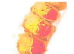
▲オリジナル商品「そばいなり」卵と紅生姜の相性は抜群！