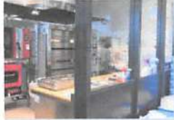
▲パンは清潔感あふれる近代的な工房で作られている。

雨の日はオトク！ 全品5%OFF 開店時に雨が降っていたら 一日中(11月末まで)