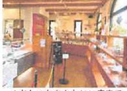
▲おしゃれなかわいい店内でスイーツが楽しく選べる。