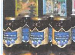
▲農産が盛んな姉妹都市グレンシャムから輸入している逸品。