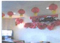
▲中には本場中国の飾りが沢山。中国にいる気分！！