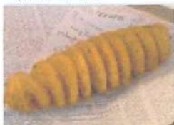
▲新メニューハリケーンポテトは外カリッ!中フワッ!