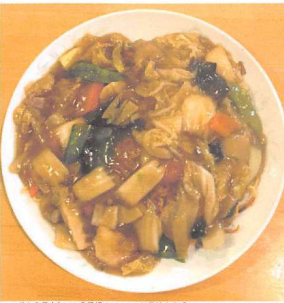
▲昔から愛されている看板メニューの五目焼きそば。味付けにもこだわりがある。