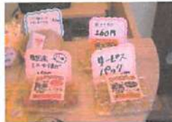
▲レジ横には手軽に買えるセットメニューが!