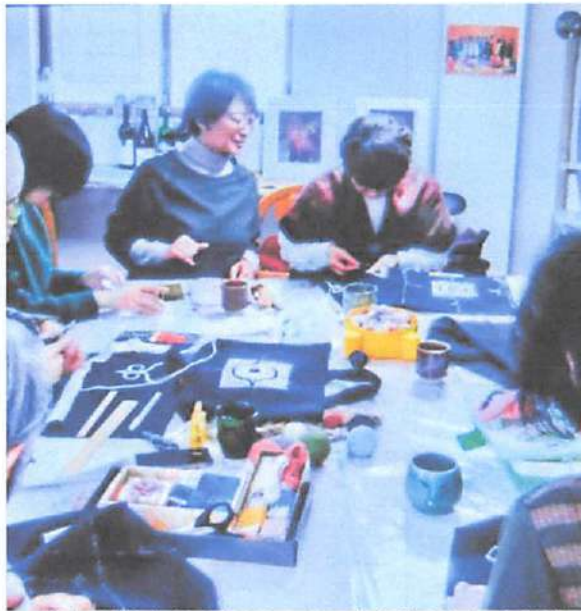
▲刺繍教室や勉強会、皆で集まりゲームをしながら食事会など、楽しく利用することができます。

利用者の中には、オーナーに人生相談を聞いて来る人も。また、ここで仕事を紹介され、ビジネスチャンスをつかむ人も！