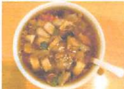
▲道産の野菜たっぷりあんかけラーメン。