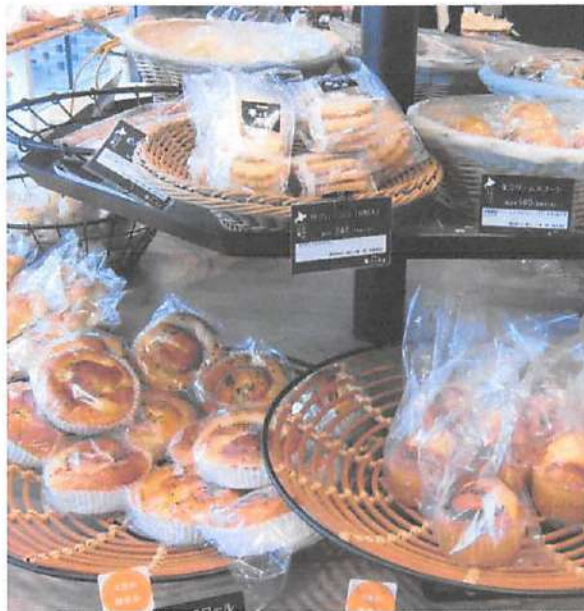
▲蓄熱性の高い石窯オープンでパリッと香ばしい直焼きのパンが焼きあげられる。お昼にはピザやサンドイッチなど全てのパンが焼きあがる。

野幌原始林にある「ゆめちからテラス」の中にある夢パン工房。明るく開放感のある店内には、おいしいパンが並んでいる。パン生地は100%北海道産の「ゆめちから」春よ恋「きたほなみ」をブレンドして使用し、地元だけでなく、江別市民にも愛される人気のお店。