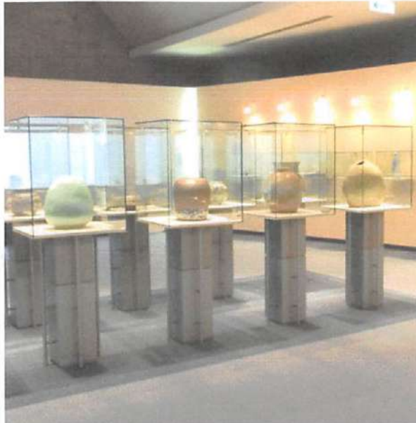
▲一つ一つ丁寧に作られている作品から、陶芸に対する作家の熱い気持ちが伝わってくる。

世界に一つだけの作品を! 陶芸体験教室 月一回(日曜日) コロナ対策として15人まで