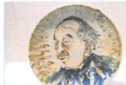
▲江別ゆかりの世界的に有名な陶芸家、小森忍さんの自画像