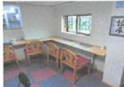
▲コロナ対策として換気や席を対面しないようにしている。

利用者の中には、オーナーに人生相談を聞いて来る人も。また、ここで仕事を紹介され、ビジネスチャンスをつかむ人も！