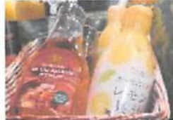
▲アガベシロップとレモン果汁で簡単にレモネードが作れる。