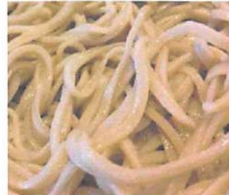
▲蕎麦粉が八割、つなぎ粉が二割の「八割蕎麦」。つるつるとのどごしが良い麺。

心を込めて蕎麦を打ち続ける本格手打ち蕎麦のまめひな。時間をかけて作っている蕎麦は、切りにもこだわり、細めてつるつとした食感の麺。至極の逸品に仕上がっている。蕎麦だけでなく野菜も自家栽培のものをできるだけ限り使用するなど、様々なこだわりが！