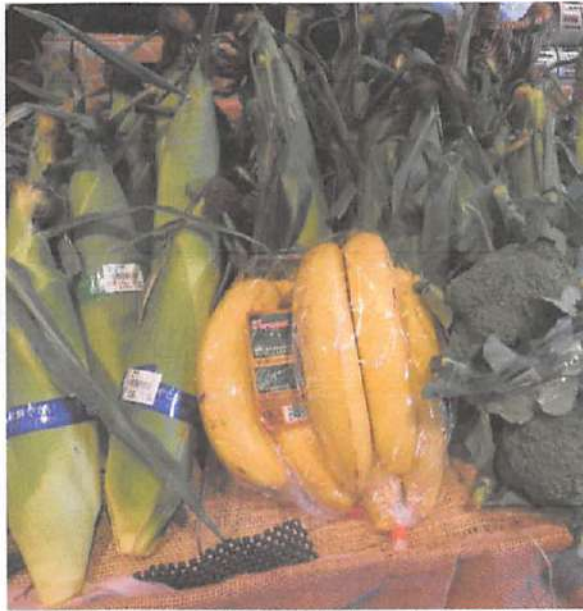
▲新鮮な野菜がたくさん。葉物野菜はしおれやすいので袋に入っています。野菜売れすじトップ3の1位はとうもろこし、2位はブロッコリー、3位はバナナ。

毎週日曜日はおいで屋の素材をふんだんに使った極上鮭おむすびを販売。ぜひ食べてみてください！