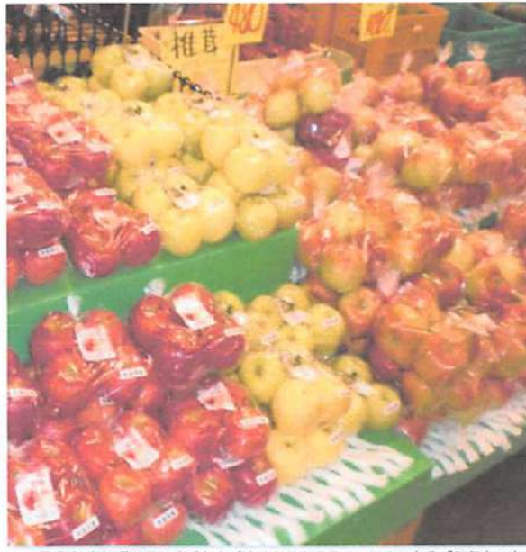
▲平成31年4月1日に完成した「ゆめちからテラス」の中にある「和気あいい」な雰囲気のにっぽろ野菜直売所

入荷時間： 午前6時30分~午前9時 新鮮な野菜を購入したい方は、早めの来店をおすすめします。午後には人気野菜やフルーツは完売する可能性があります。