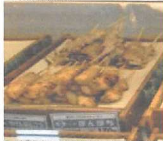
▲美唄焼鳥は卵の黄身を使用した独特な焼鳥。美唄生まれの味を江別で食べられる。

北海道で14年間続くチェーン店である炎。その炎の看板メニューである塩ザンギは提携農家から直接仕入れられている伊達黄金鶏を使用。普通の肉よりやわらかいのが特徴。さらに11種類のスパイスで調合されたタレとの組み合わせは絶品。他の焼鳥も国内産鳥を使用している。ぜひご賞味あれ。