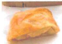
▲月に一度の限定メニュー。10月～3月はアップルパイ。