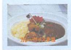
▲カレーライス弁当 (300円)