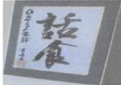
▲オーナーの思いが一言で表されています。