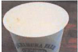
▲アイスクリームはキャンプ場の人たちからも人気。