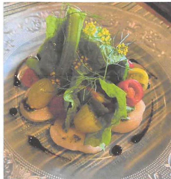
▲素材は北海道産のものを多く使用し、江別にこだわっている。小麦は全て北海道産で、その小麦でパンやパスタ、ピッツァは絶品！