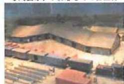
▲約二百年前のれんが工場を再現した模型。

世界に一つだけの作品を! 陶芸体験教室 月一回(日曜日) コロナ対策として15人まで