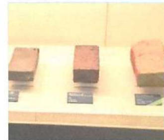
▲左から韓国、中国、ドイツのれんが。大きさは職人の手のひらサイズを表している。

創立二十六年。江別産のれんがをおよそ十七万個使って建てられた施設。その中には、北海道を中心として活躍している方々の陶芸作品がある。また、江別の象徴であるれんがの歴史についても知ることができる。陶芸教室などのイベントも開催している。