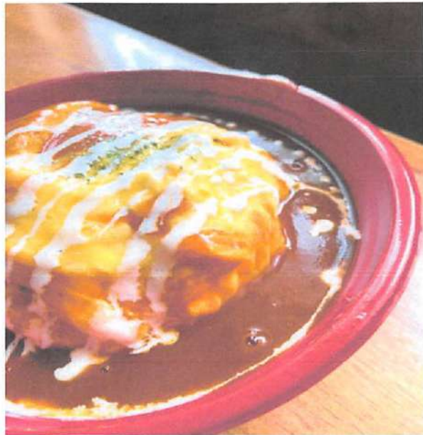
▲日替わりのランチは手作りのオムライス等の家庭的な料理が多い。※現在は休止中