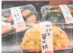
▲旬の食材を使用した期間限定のおむすび。