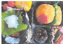
▲現在、新型コロナウイルスの影響により弁当を販売中。