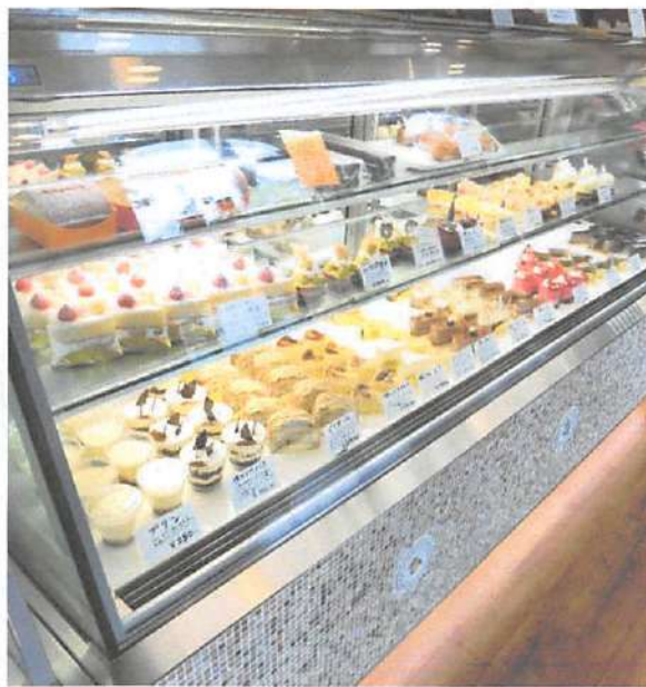
▲ケーキで25種類、焼き菓子、チョコレート、ジャム等を合わせると100品ほどが並び、きっと好みのスイーツが見つかるはず。