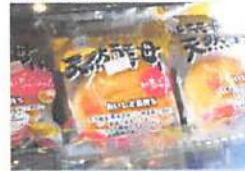
▲野菜以外のものも！江別産小麦で作ったパンなどたくさん！