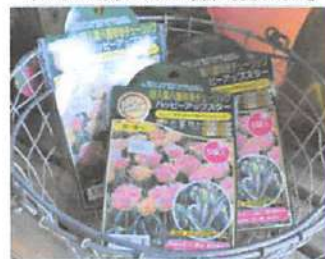
▲ハッピーアップスターなどの珍しいチューリップの球根も販売中!

豊かな自然に囲まれ、まるで物語の中にいるような雰囲気!「庭の花」という店名には、庭に植えたり家の玄関先などを彩るためのお花がたくさんありますよ!という意味が込められているそう。きれいな花と手作りのおいしいケーキの両方を一度に楽しむことができ、心安らぐひとときを過ごすことができます。