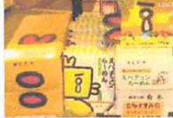
▲江別産ハルニタカを使用し風味豊かで歯ごたえのある麺。