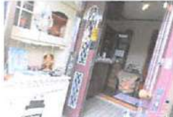
▲カントリー雑貨やツールペイント溢れる店内。