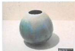
▲キラキラとした輝きをもち、お客様の目をひきつける作品