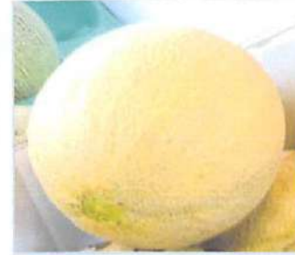
▲フレッシュでおいしい夕張メロンは今の時期とても売れている人気商品です！

EBRIの中にある八百屋さん。約百種類以上の商品を取り扱っていて新鮮な野菜や果物がたくさん！野菜の多くは国産なので安心・安全。江別産のものもたくさんあります。営業時間は10時～18時と短いですが、昼食や夕食の準備にちょうどいい時間にやっているので、その頃をめぐって行ってみるのもよいでしょう。