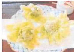
▲自家製の野菜を使った季節の天ぷらは絶品。