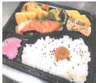
▲肉や魚、揚げ物等が好みで選べて色合いが綺麗なお弁当。税込 500 円の安さも魅力

野幌駅南口からまっすぐ進むと見えるビッグハウス野幌店。その中にある「おむすび処 安曇野」。魚沼産のお米や札幌の二条市場で厳選した具材を使ったおにぎりも人気。おにぎりは9種類あり、他にもメニューが多数。まだ食べたことのないおにぎりを味わってみませんか？