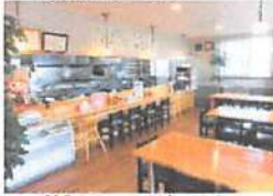
▲創業からアットホームな雰囲気が変わらない内装。