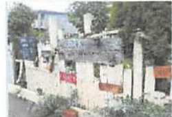
▲外観は自然を中心とした隠れ家的な印象。