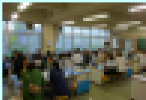
【交流委員会での話し合いの様子】

また、6月12日（水）には交流委員会を開催し、今年度の活動について確認しました。夏休み明けから各学年でレク等を行うと思います。交流委員の方々を中心に、保護者の皆様のご支援・ご協力をお願いいたします。