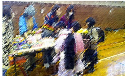
体育館で景品選び