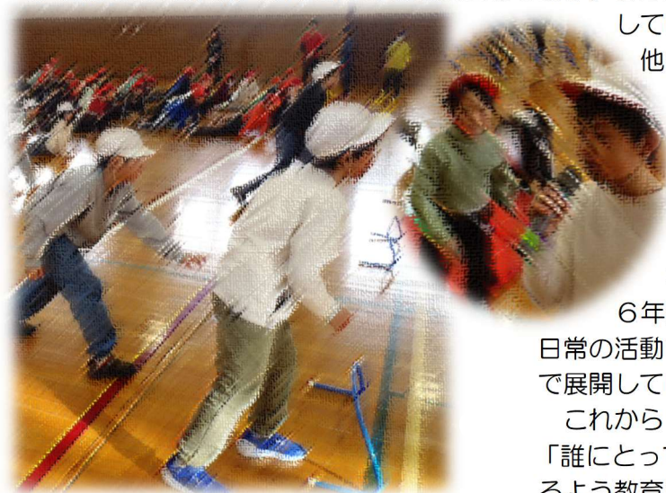
体育委員会企画「障害物だるま」

これからも、子どもひとりひとりにとって、学校生活が「誰にとっても楽しく」「将来為になる経験が積める」場となるよう教育活動を進めてまいりますので、保護者・地域の皆様には、昨年同様のご支援・ご協力をお願いいたします。