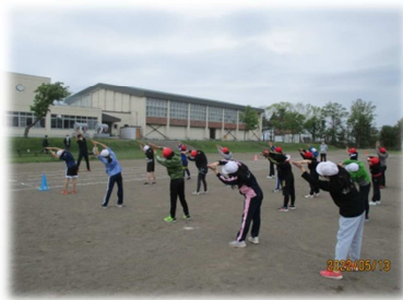
＜体育「はましんダンス」＞