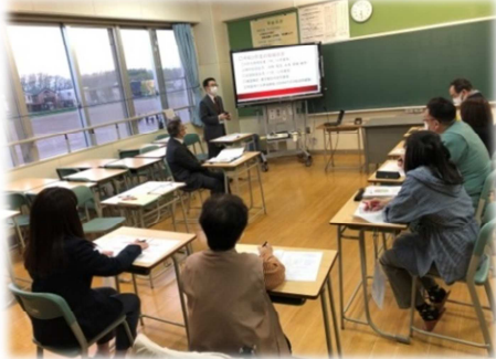
＜学校運営委員会の様子＞