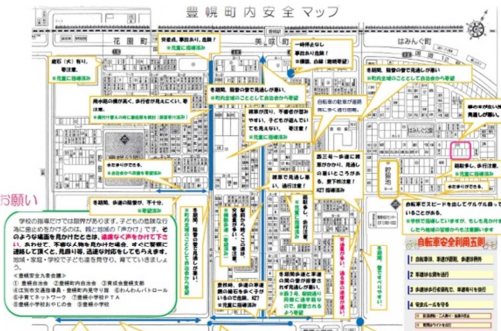
＜豊幌小校区 安全マップの検討＞