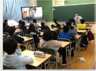
＜中央中校区の小中一貫教育について＞