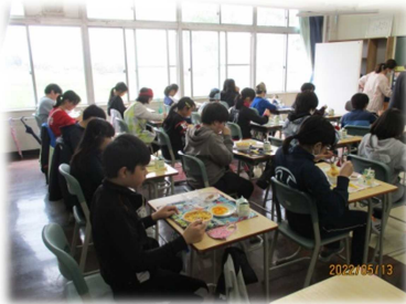
＜中学校での給食 「パスタの量がいつもより多いよ」＞

大麻東中学校区（大麻東小学校・大麻泉小学校・大麻東小学校）が、5月13日（金）に今年度1回目の6年生中学校登校を実施しました。今回は、大麻泉小学校の児童が中学校の授業と給食を体験しました。この中学校登校は、義務教育9年間を見通した「一貫した指導」と「系統的な指導」を可能とする「相乗的・補完的な指導」の重要な取組の一つとなります。特別支援学級の合同授業では、中学生が小学生に優しく声をかけてあげる場面が見られました。体育科の授業では、中学校の先生オリジナルの準備体操を一年早く教えてもらい、とても楽しそうに体を動かしていました。また、短距離走で速く走るためにはどうしたらよいかを皆で考え、指導してもらったことを自分の走りに生かしていました。授業中の子ども達の目の輝き、意欲的に学習に取り組む姿が印象的でした。6月には大麻東小学校の中学校登校体験が行われる予定です。