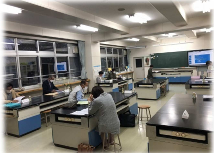
＜学校運営委員会の様子＞