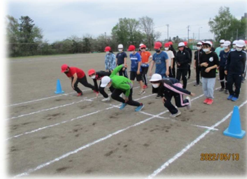
＜真剣に練習する子ども達＞