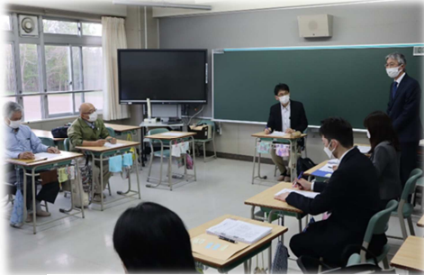
＜学校運営委員会の様子＞