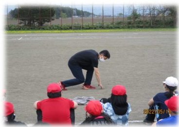
＜スタートの姿勢・足の位置＞