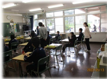
＜特別支援学級合同授業＞