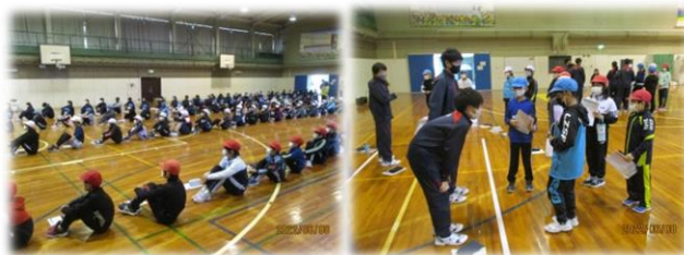
聞く姿勢が素晴らしい 宜しくお願ひします！

初めに、小中学生混合のグループで挨拶や自己紹介、準備運動の「江陽体操」を一緒に行いました。次にグループごとに各種目に取り組みました。「反復横跳び」では、リズムカルに跳べるように中学生が小学生の手をとり動き方を教えていました。「立ち幅跳び」では、中学生の大きな跳躍を見て小学生から感嘆の声が聞こえました。「握力」では、測定をしている子どもに対して「フレイフレイAさん！」と皆で応援する姿が見られました。他にも、中学生が小学生に対して「すごいよ、Bさん！」「いいよ、いける！」「早いよ、がんばれ！」等と励ます姿や、「腕は胸にあてるんだよ。」「次は体育館にもどるよ。」「記録をちゃんと覚えておくれんだよ。」「忘れ物ないかな？」等、声をかける様子が見られました。