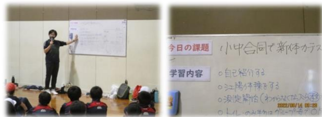
子どもたちの課題意識や意欲を高める

江別太小学校と同じように、互いに挨拶と自己紹介、準備体操の「江陽体操」を行ってから各種目に取り組みました。豊幌小学校の5年生が全部で16名のため、小学生1人に中学生2～3人がつく形でグループをつくりました。そのため、中学生が「次は立ち幅跳びをするよ！」「水を飲んでいいよ！」等と小学生に声をかけ、気遣う場面がたくさん見られました。また、今回は時間的に少し余裕があったので、最後に持久力を測定する「シャトルラン」に挑戦しました。その際も、見守る小学生や中学生から自然と「がんばれ！」と応援する声がかかり、拍手の音が体育館に響きました。