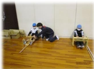
中学生がやり方を教え、測定をしてくれます