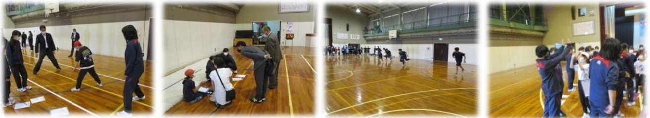
校長先生や学校運営委員さんも言葉をかけてくれます 交流を通じて中学生の凄さや優しさを感じる小学生

授業の最後は、小中学生が輪になってお礼の言葉を言い合い、指導者の先生が「中学生が一生懸命小学生に教えてくれて感謝しています。小学生も笑顔で頑張ってくれて良かったです。ありがとうございました。」との学習のまとめを行いました。会場の体育館全体が温かい雰囲気にも包まれたように思います。今回の取組は、体を動かす活動を通して小中学生が交流を深める、中学生が「人に教える、人の役に立つ」体験をし自己肯定感や自己有用感を高める、小学生が中学生への憧れや運動への意欲を持つ、思いやりの心や協力性を育む等、確かな成果をあげることができました。