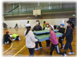
一緒に道具を片付け、「指スマ」をして仲良く