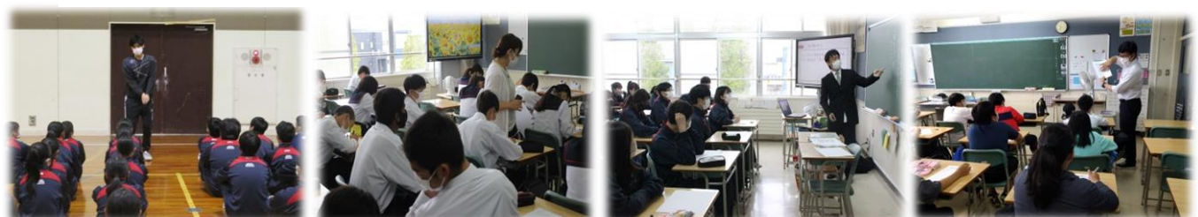
江別太小学校と豊幌小学校の先生による体育科、英語科、道徳科の乗り入れ指導