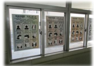
↑ 拡大印刷した大型版を掲示 ↑ (教室掲示) 中央中学校区スタンダード (玄関掲示)