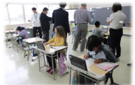
3年生と4年生の複式学級での研究授業

北光小学校で石狩教育局指導主事による学校教育指導が行われ、第三中や第一小、いずみ野小の先生方も参加しました。北光小の3、4年生の複式学級の「わたり」の授業を参観し、子どもたちの学びの様子や授業改善の取組について共有しました。学校教育指導への相互参加の取組は、「系統的な指導」や「一貫した指導」の効果をさらに高め、中学校区の授業改善や学力の向上に資する等、価値のある実践です。