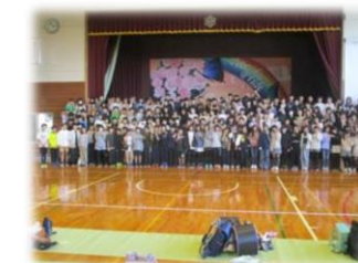
3つの小学校で記念撮影