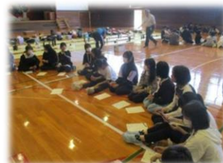
3校の小学生が協力して制作！