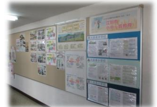
↑教室の他に小中一貫教育コーナーに掲示↑ (教室掲示) 大麻東中学校区スタンダード (玄関掲示)