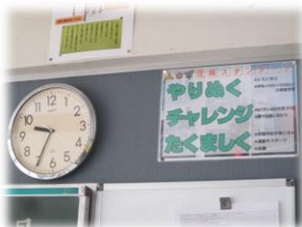
江陽中学校区スタンダード