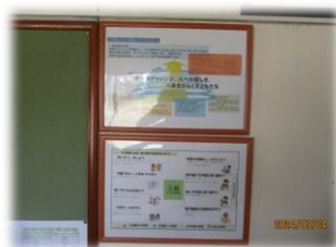
第三中学校区スタンダード