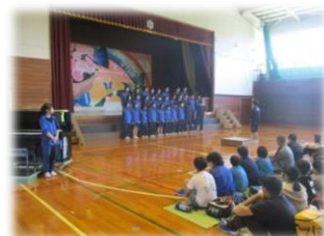
中学3年生の合唱を鑑賞しました！