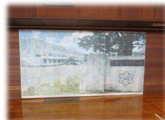
完成したモザイクアート