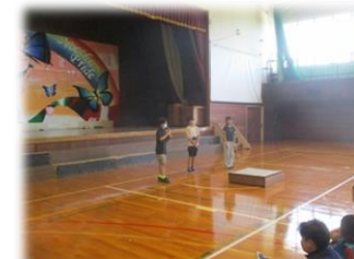
小学生が感想を発表