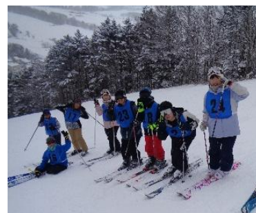
1月21日萩の山スキー場にて

冬休み中は少雪で、心配しておりましたスキー学習ですが、上野産業様のご尽力により、立派な大麻小スキー場ゲレンデが完成いたしました。下の学年が使いやすいように高学年が踏み固めて整えてくれ、スキー学習が進んでおります。3年生以上は岩見沢萩の山市民スキー場での学習もあります。子どもたちのスキー学習に関しまして、学習環境整備、指導支援に地域の皆様、保護者の皆様の多大なお力添えをいただいておりますことに、心よりお礼申し上げます。