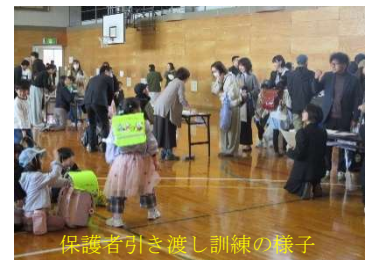
保護者引き渡し訓練の様子

5月9日の土曜参観日には、たくさんの保護者の皆様が来校くださり、学校の様子 の参観と、同日実施の引き渡し下校訓練にご協力いただき ました。訓練は実際の動きを想定してはいますが、状況 に応じた対応が必要となりますので、実施によりいろい ろな確認をすることができました。貴重なお時間をいただき、 ありがとうございました。