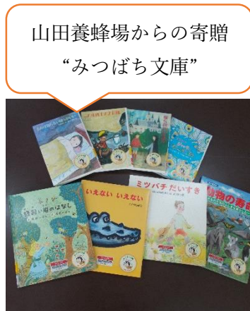
山田養蜂場からの寄贈 “みつばち文庫”