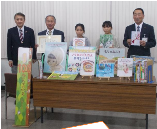
江別グリーンライオンズクラブ文庫の贈呈式 (R5.11.7 教育委員会にて)