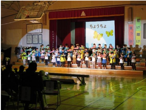
おもいでっかい 1年生

インフルエンザの流行期にぶつかり、心配もありましたが、無事に予定通り開催することができました。4年生以上の児童は実行委員として、会全体を支えようと頑張る姿が見られました。大勢の前での発表と、観客からの賞賛の拍手はとても貴重な経験となりました。