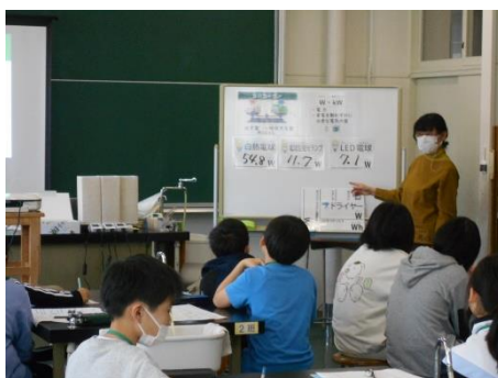
5年生;総合的な学習・環境学習(ワットモニター講座)