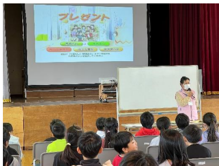
3年生;人権教室 互いを尊重し合う気持ちを学びました