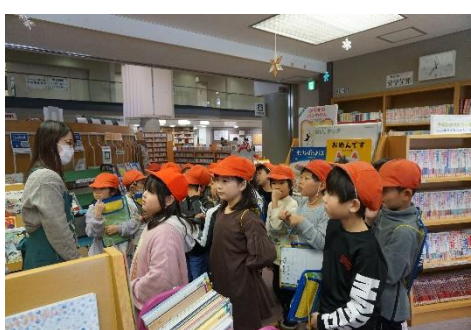
2年生;情報図書館見学 バスに乗って図書館見学に。