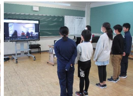
児童会書記局;泉小学校との meet を使った合同挨拶運動