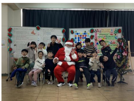
あさがお学級クリスマス会 サンタさんを招いてゲームや音楽発表！