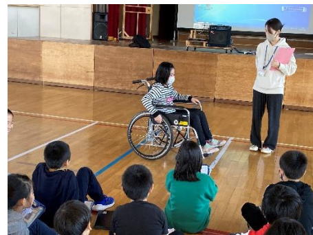
4年生;総合的な学習・福祉学習(車椅子体験)