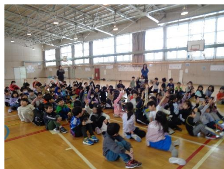
1・2年生;生活科・おもちゃフェスティバル ～1・2年生合同の交流学习。2年生が計画し1年生をご招待！