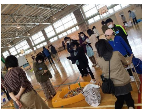
ことばとまなびの教室 ・親子レク ～通級指導教室には自校・他校合わせて60名近くの児童が通っています。