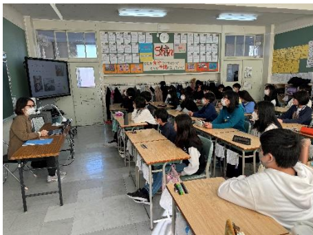
6年生;スクールカウンセラーによる授業“思春期の心”