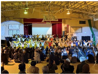
きらきら 1年生 ～思い出いっ ぱい1年生