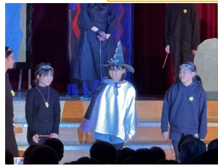
魔法をすてたマジョリン