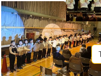
The Gift of Music