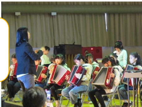
サウンド クエスト ～アニメ&ゲーム 音楽の世界へ～