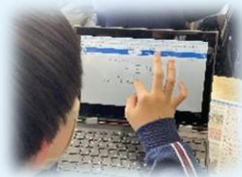
↑新しいデジタルドリルです