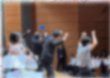
新しい学校のリーダーズ？