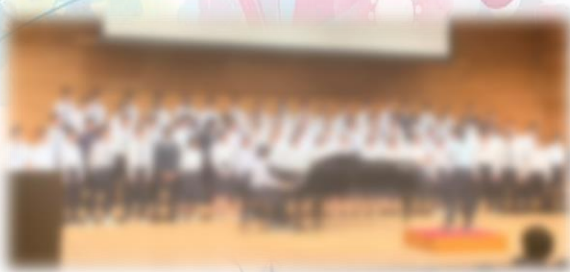
3年生学年合唱「大地讃頌」