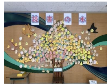
葉と実であふれた読書の木

次の登校日は1月16日（月）です。元気な姿の子どもたちと再会できるのを楽しみにしています。