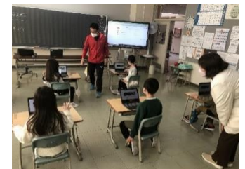
1年生もタブレットを使っています