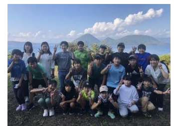
晴天に恵まれた修学旅行（去年は雪でした）