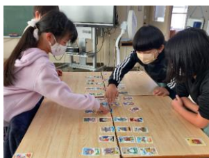
3年生 いろはかるた