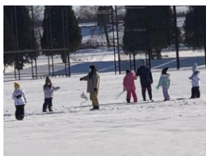
1年生 たこあげ(自作)

先日、12月17日(土)に土曜授業が行われました。その日は、学校全体が和の雰囲気一色でした。「はい」と元気にカルタを取る声が聞こえてきたり、お多福、ひよっとこの福笑いなどに夢中になったり、子どもたちは楽しく活動しました。