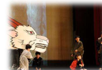
すくすく【白見の竜】