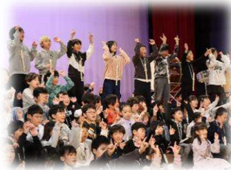
4年生【ハートフル ～みんなの温かい心 でみんなかがやく～】