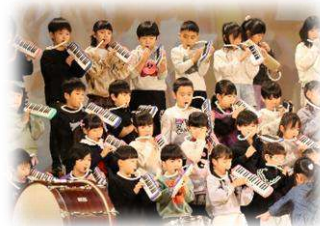
1年生【はじめのことば】 【ドレミとなかよし】

「無限の可能性、心ひとつに舞台で出会う 新しい自分」をテーマに、「つながろう」「やってみよう」「やりぬこう」の気持ちを大切にしながら練習に取り組んできた学習発表会が終了しました。ご来場いただいた保護者の皆様、地域の皆様からは、温かい拍手をいただきました。ありがとうございました。