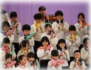
3年生【音楽で世界を ほうけんしてみよ！】