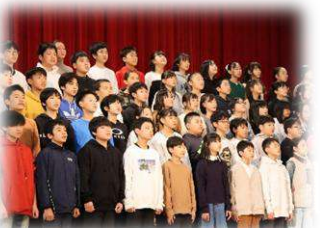
6年生【想～伝えたい気持ち～】