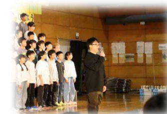
6年生【おわりのことば】