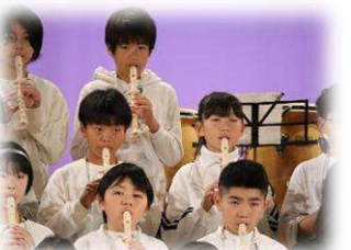
5年【この空のどこかで】