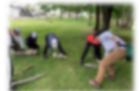
専門家からの学び