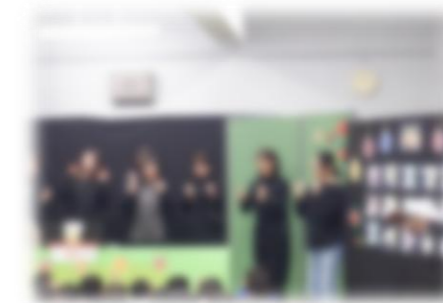
読み聞かせボランティア